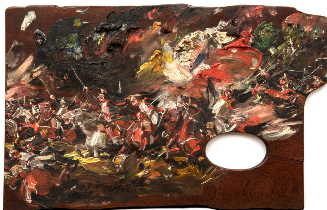
Francisco Domingo Marqués, Paleta pintada , Museo Sorolla, n.º inv. 1301