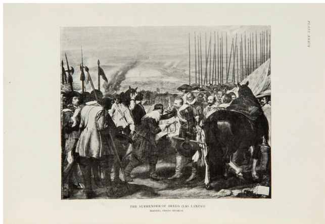
Aureliano de Beruete, Velázquez , Museo Sorolla, n.º inv. FA 397