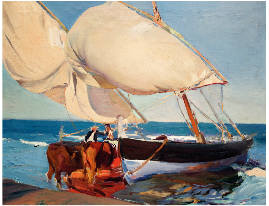
Joaquín Sorolla Bastida, Las velas , 1915, Museo Sorolla n.º inv. 1136