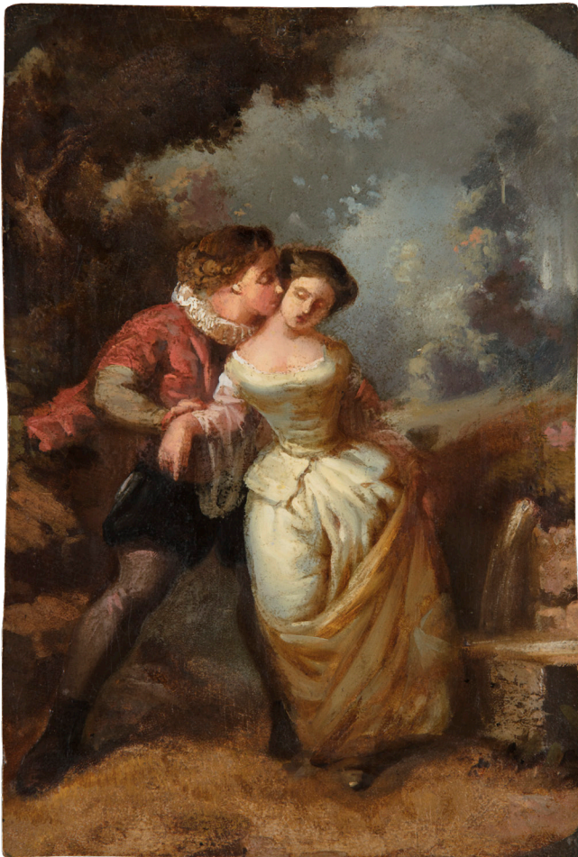
Mariano Fortuny y Marsal, Pareja de enamorados , 1856, Museo Sorolla, n.º inv. 1302