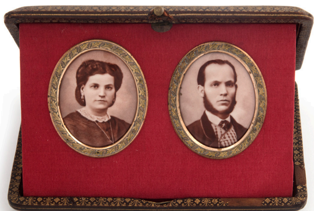
Portarretrato de los padres de Sorolla, Museo Sorolla, n.º inv. 90061