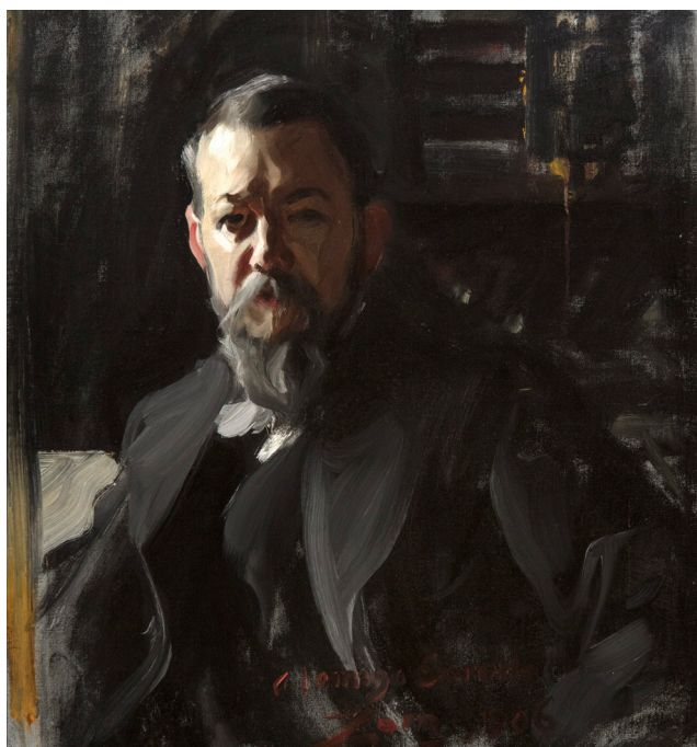
Anders Leonard Zorn, Retrato de Sorolla , 1906, Museo Sorolla, n.º inv. 1341