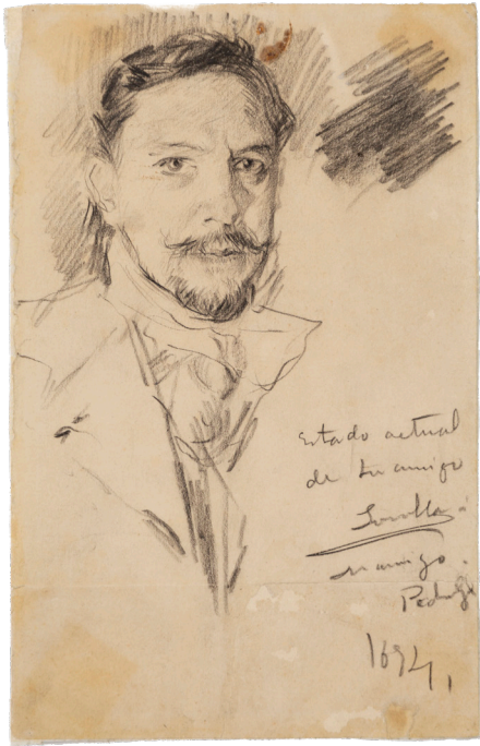
Joaquín Sorolla Bastida, Autorretrato , 1894, Fundación Museo Sorolla, n.º inv. 15603