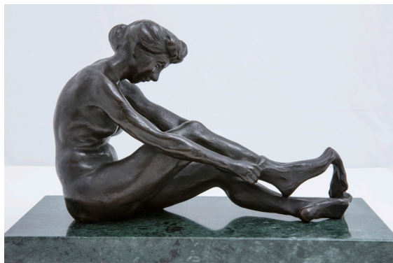
Yvonne Serruys, Mujer poniéndose una media , ca. 1909, Museo Sorolla, n.º inv. 20077